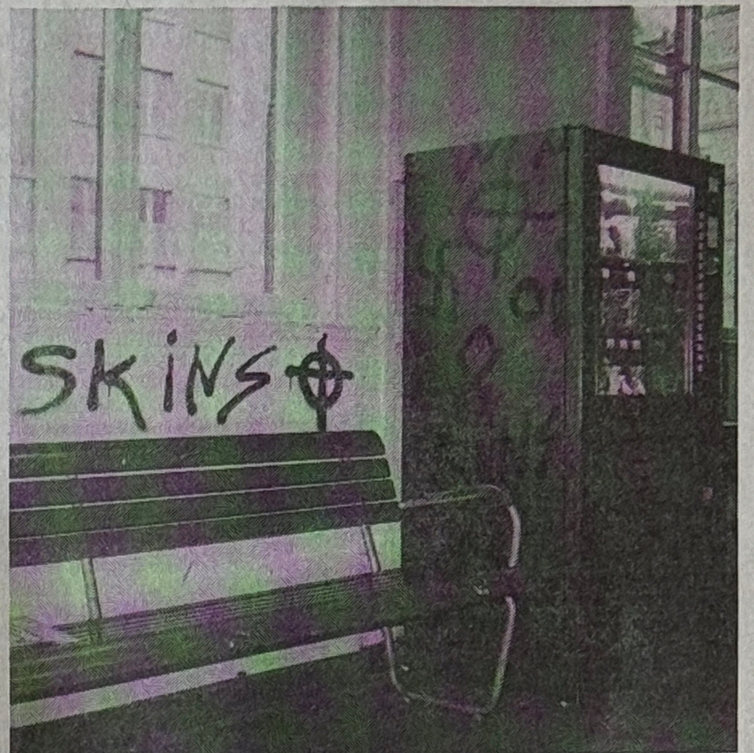
Bei solcher Hinterlassenschaft muss man tatsächlich nicht lange nach den Tätern und ihrer Ideologie suchen.