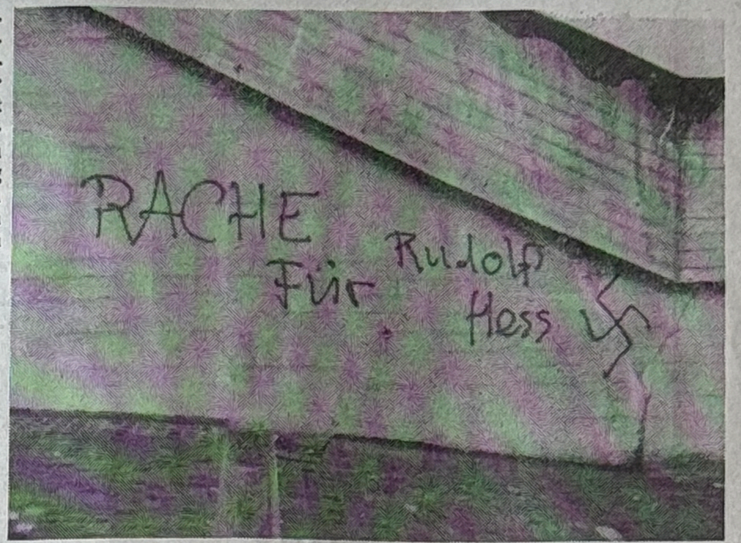
Diese Sprayerei auf dem Mauerwerk der Gewerbeschule ist nur einer von vielen Belegen für die Umtriebe der Neonazis.

Am Dienstag vergangener Woche wurde Dürr vom Obergericht des Kantons Aargau zu 30 Monaten Gefängnis unbedingt verurteilt. Neben der Tötlichkeit im Dörflinger Postauto wurden ihm dort auch andere Straftaten zur Last gelegt. Deshalb fand das Verfahren im Kanton Aargau statt. So griff Dürr vor rund zwei Jahren im Bahnhof Baden zusammen mit drei Skinhead-Kollegen einen ahnungslosen Passanten an, zog ihm eine halbvoll Bierflasche über den Kopf, traktier-